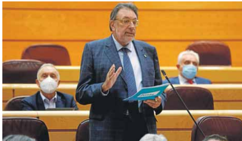
Josep Lluís Cleries, ahir durant una intervenció al ple que es va fer al Senat