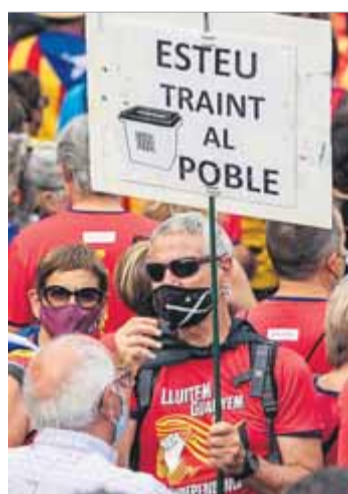
Detall d'aquesta Diada

sa d'accident davant un conductor violent no és una opció realista, per la senzilla raó que el conductor violent no la vol, i només vol agredir-nos fins que fem el que ell vol.