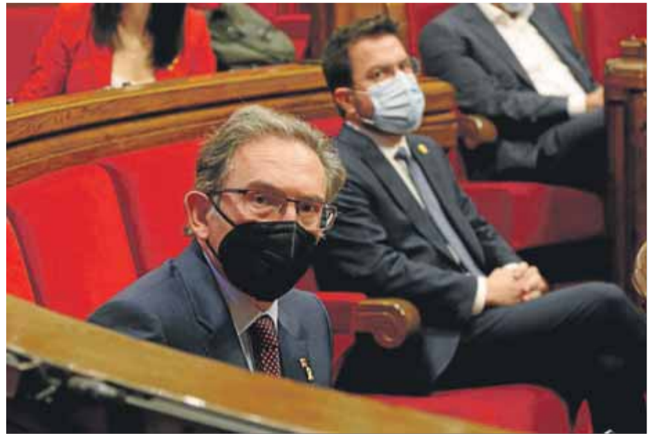
El conseller Giró durant el ple del Parlament del 29 de juliol passat

Sobre les línies mestres dels comptes, el conseller va avançar "alguns retocs" fiscals per beneficiar els col·lectius amb menys recursos. "La pressió fiscal no pujarà, però estem treballant perquè hi hagi bones i justes notícies per a