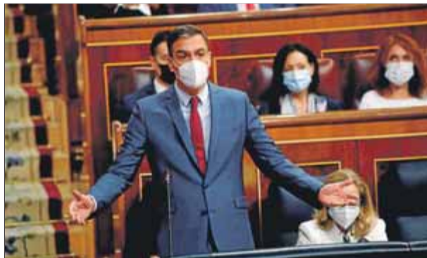
Pedro Sánchez en la seva intervenció d'ahir

El líder del PP, Pablo Casado, va fer una interpellació directa al respecte al cap de l'executiu espanyol, Pedro Sánchez, quan el va instar a «complir la seva paraula» i «pressionar» per a l'extradició de Puigdemont. Sán-