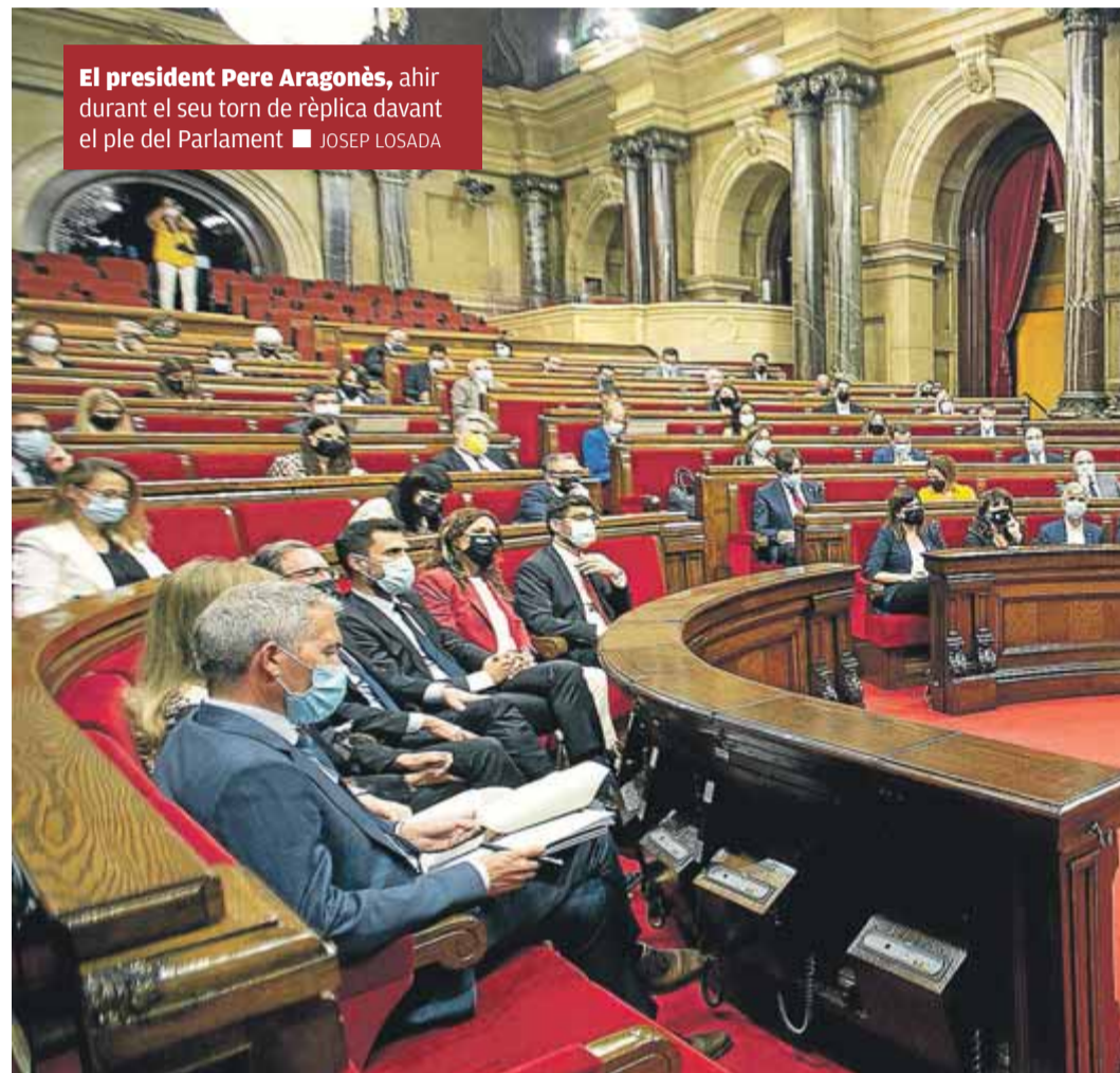
El president Pere Aragonès, ahir durant el seu torn de rèplica davant el ple del Parlament

El president, en canvi, va concentrar les crítiques en els grups que el formen,