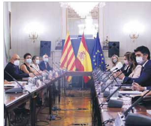
Reunió a Madrid de la comissió bilateral entre representants del Govern i de l'Estat l'any passat.