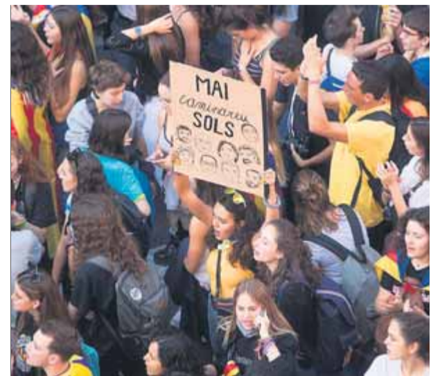
Imatge d'arxiu duna manifestació convocada pel Sindicat d'Estudiants dels Països Catalans (SPEC)

nal Suprem. El polonès considera que el tribunal espanyol no va complir "l'obligació de cooperació lleial". "Pot efectivament semblar que el comportament del Tribunal relatiu a aquest afer no compleix aquesta obligació", indica. Ara, cal esperar la sentència del TJUE. Normalment, les decisions del tribunal segueixen l'opinió de l'advocat general, però no són vinculants i poden anar en un altre sentit. ERC ja ha avançat que continuaran la batalla judicial per reivindicar l'escó de Junqueras. ■